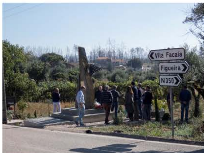
Monumento às vítimas do incêndio de Pedrogão.