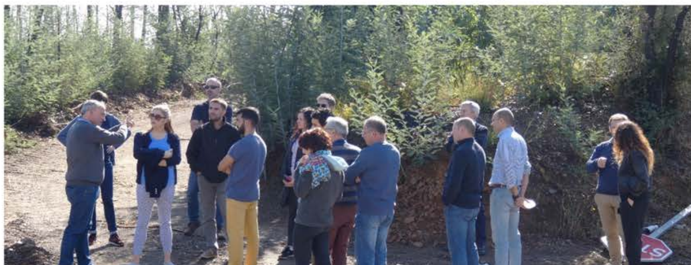
Membros do Risk AquaSoil visitam a estrada 236-1.