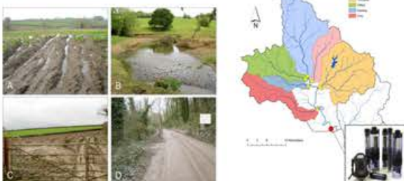
Monitorização da bacia do rio Tamar.

Intervenções de segmentação – monitoramento Targeting interventions - Monitoring