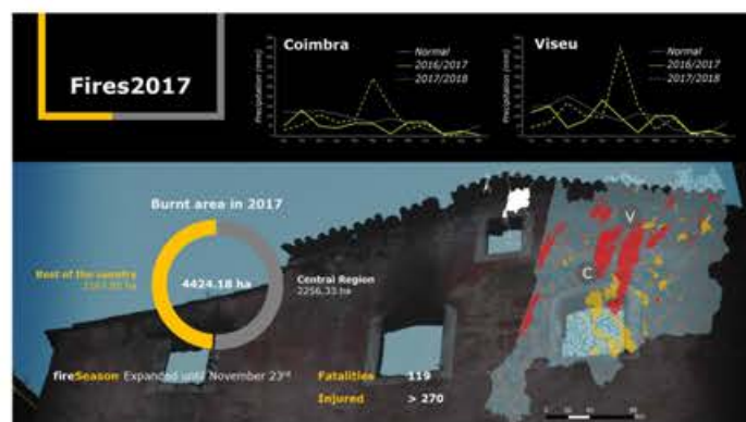
Áreas ardidas nos incêndios de Portugal em 2017.

Evidências da influência do fogo foram visíveis durante as primeiras campanhas, no entanto, a evidência mais convincente foi uma maior erosão dos solos com mobilização de materiais e um aumento da concentração de ferro, manganês e alumínio, associados a minerais de argila. Durante todas as campanhas, nenhum hidrocarboneto aromático policíclico ficou acima da quantificação, e nenhum parâmetro parece ter concentrações que possam colocar em risco a saúde pública.