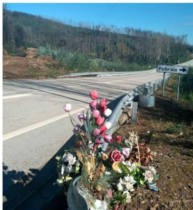
Flores de tributo às vítimas do fogo.

Os membros do Risk AquaSoil também se reuniram com a Associação de Vítimas do Incêndio de Pedrogão Grande na sua sede, trocando experiências sobre o impacto que as alterações climáticas tiveram sobre os incêndios, e como as comunidades locais podem se tornar mais resistentes a estas alterações.